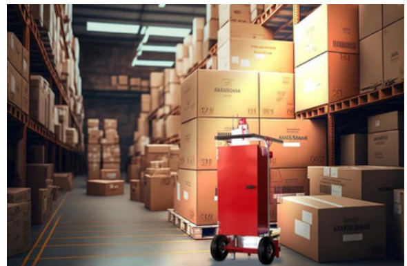
Sicherheit in Lagerhallen und -zelten