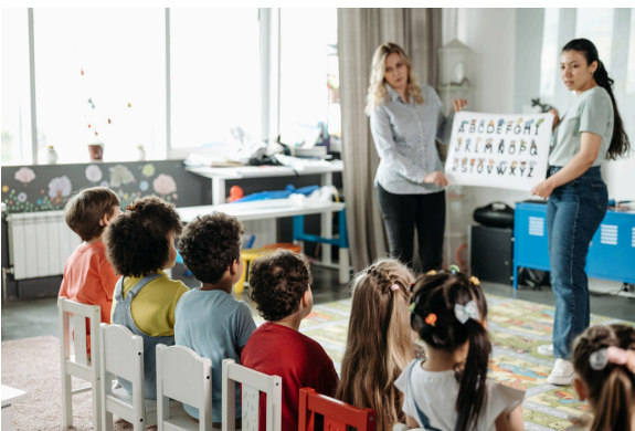
Sicherheit in öffentlichen Einrichtungen