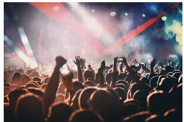
Sicherheit bei Großveranstaltungen