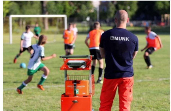
Sicherheit auf Sportveranstaltungen